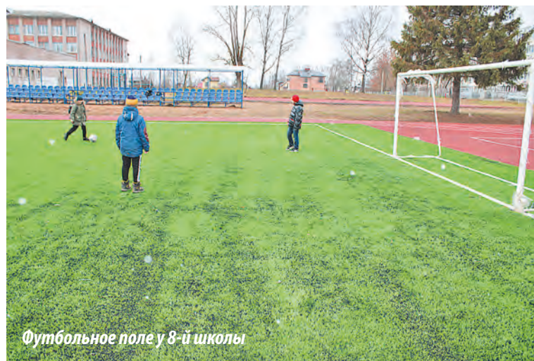
Футбольное поле у 8-й школы