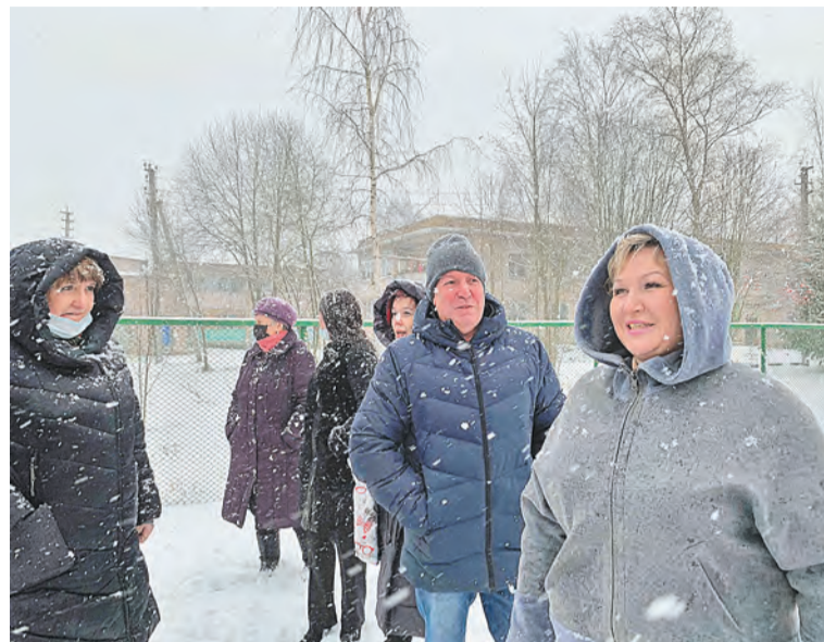
На спортплощадке в Сосновке

было и посещение Опеченского сельского поселения, где встретила с погорельцами деревни Перелучи.