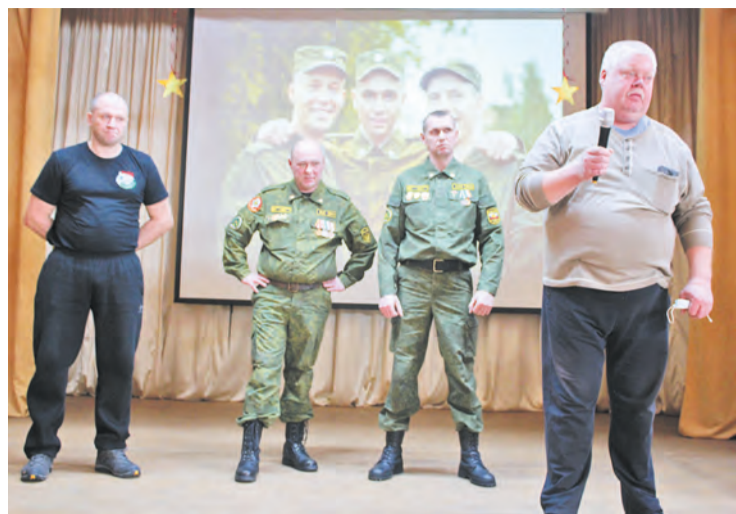
Выступают ветераны «Боевого братства»