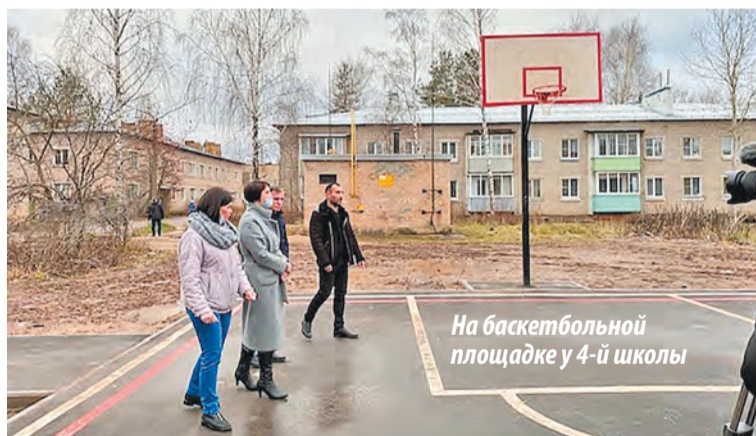
На баскетбольной площадке у 4-й школы

Для баскетбольной площадки выполнили бетонное основание, причём, с дренажной системой. Сверху бетона уложили асфальт, нанесли игровую разметку. Местные