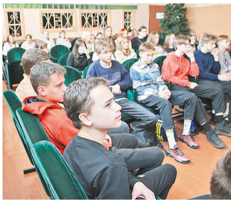
Ученики 9-й школы – будущие призывники