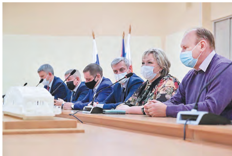
Диалог с депутатами и главами сельских поселений

Для ее решения сейчас разрабатывается проект федерального закона. В ходе разговора договорились, что в поселениях соберут всю необходимую информацию и предложения для последующей передачи в Минсельхоз России.